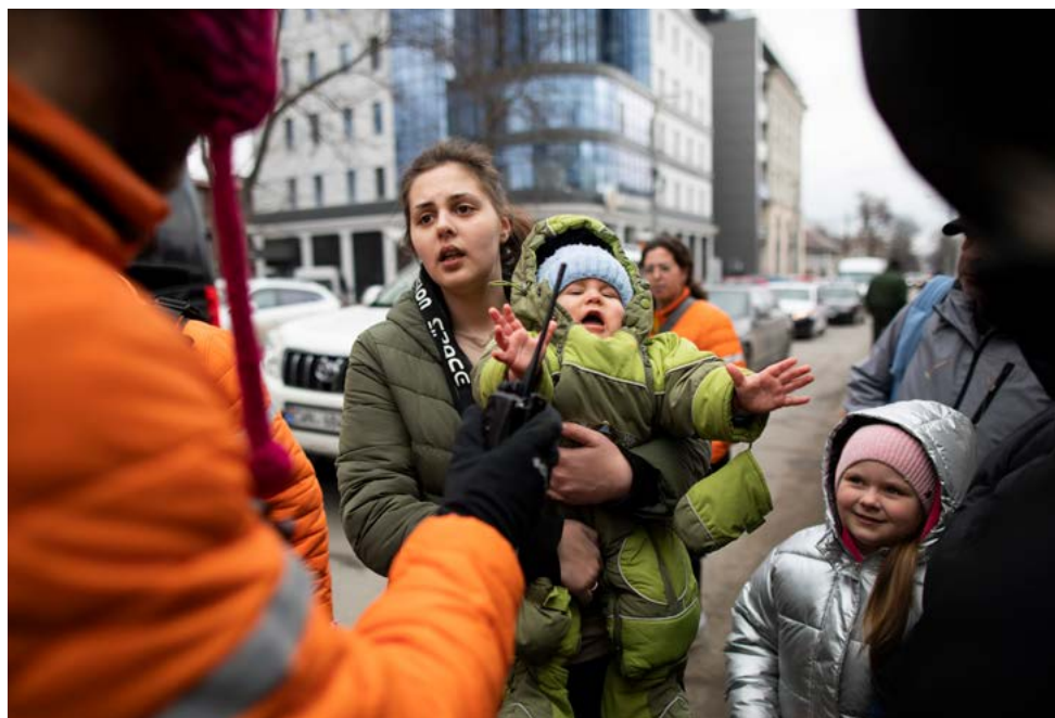
Photograph: Abir Sultan